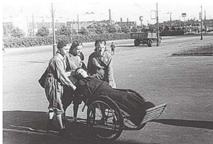
Сандружинницы ПВХО госпитализируют раненую при артобстреле (на заднем плане ДК им. Ильича, нынешний Культурно-досуговый центр «Московский»).

Дом культуры Ильича, построенный в 1929-1931 годах по проекту Николая Демкова — один из наиболее ярких и интересных примеров конструктивизма в эпоху расцвета этого направления. Искусствоведы относят его к стилю «ленинградского авангарда».