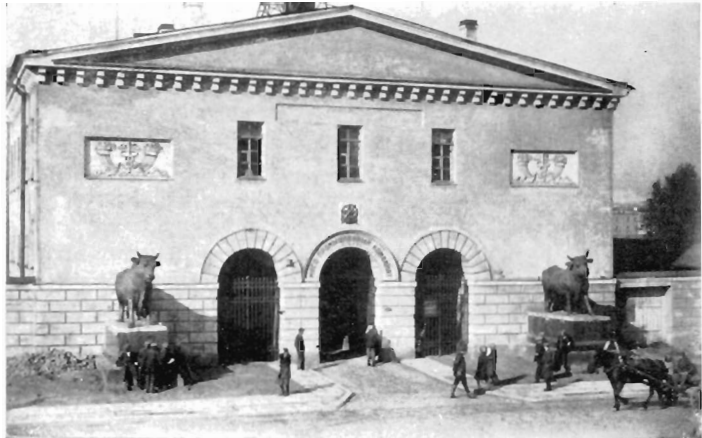
Я. П. Шарлемань 1-й. Здание б. Скотопригонного двора (Московский проспект, 65).

Многочисленные наблюдения за животными, их нравом и повадками, тщательное изучение анатомии в сочетании с мастерскими приемами лепки позволили талантливому русскому скульптору В. И. Демут-Малиновскому создать высокохудожественное реалистическое произведение анималистического жанра; монументальные бронзовые быки заслуженно относятся к лучшим его работам.