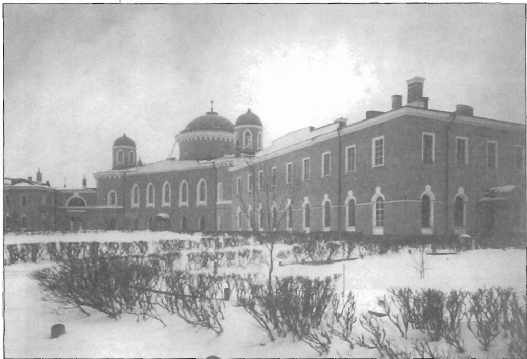
Чесменская военная богадельня. начало XX в.

В 1827 и 1828 гг. во дворце разместили юных воспитанниц Елизаветинского института в связи с его перестройкой, а в 1830 г.