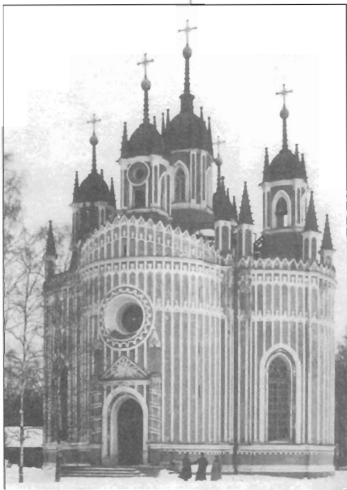
Чесменская церковь. Фотограф Карл Булла, начало XX в.

Несколько десятилетий дворец пустовал и приходил в запустение. Кстати, в ночь с 5 на 6 марта 1826 г. в дворцовой церкви,