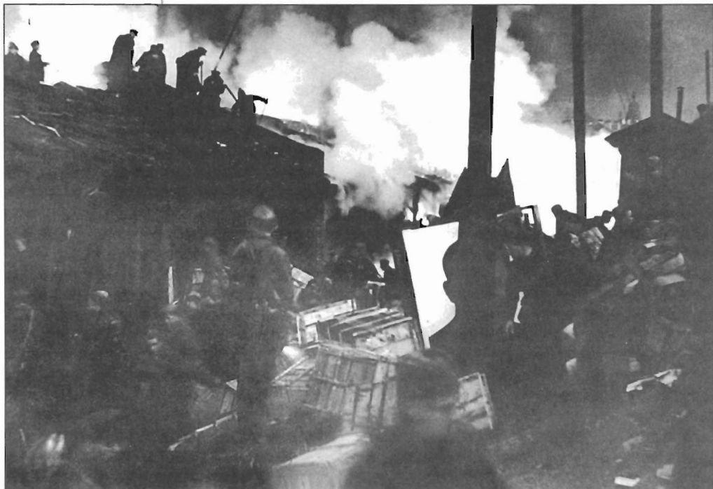
Курсанты военных училищ тушат пожар на Бадаевских складах, 8 сентября 1941 г.

После войны Бадаевские склады продолжили свое существование, став с 1965 г. Базой им. Бадаева. К середине 2000-х гг. стало очевидным, что существование огромных, находящихся в аварийном состоянии складов вблизи исторического центра Петербурга и в непосредственной близости от правительственной трассы,