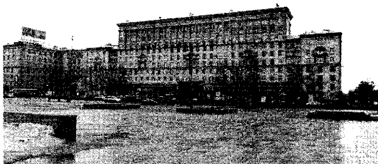
Вид с Московской площади

Московский район расположен в юго-западной части города и граничит с Кировским и Красносельским районами — по Балтийской ветке железной дороги, с