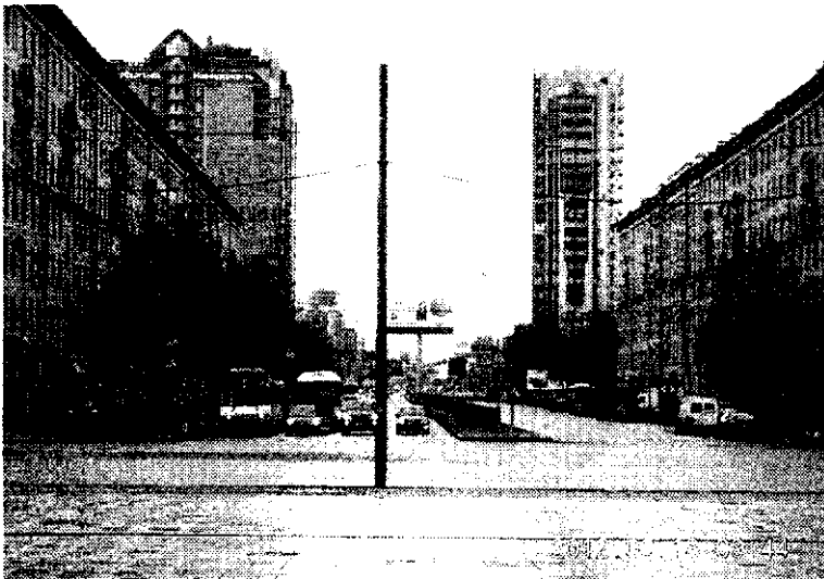
Вид на Ленинский проспект

именно Московский проспект (бывший Царскосельский) служил своеобразной осью, вокруг которой разрастались и села, и деревни, и сам Московский район, постепенно их поглощавший. В современных границах он существует с 1965 года.