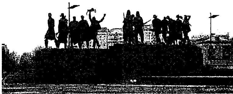
Монумент героическим защитникам Ленинграда

Весной и летом гостей города и петербуржцев поражает не только великолепие фонтанов на Московской площади, но и огромное количество цветов вдоль Московского проспекта: на клумбах и в вазонах высаживается до семисот тысяч цветов всевозможных форм и оттенков.