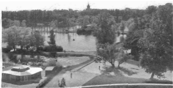
Судьба появления прудов парка Победы непро-

Начнём с топонимов. В северной части парка всего два пруда – Пейзажный (круглый, с тремя островами) и Командорский. В южной части парка их намного больше – семь. Пруд, прозванный в народе «Очками» (по схожей форме), называется Квадратным, восточнее его – Фонтанный (когда-то там хотели создать фонтаны, но сейчас даже форсунок нет), который проливчиком соединяется с Командорским. Южнее последнего – Адмиралтейский пруд (там находится лодочная станция, и на его берег выходит ротонда), чуть восточнее – Капитанский, потом Детский, а самый юго-восточный (почти на углу Гагарина и Бассейной) – Матросский.