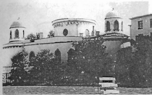
Чесменский дворец. В настоящее время ГААП. Современная фотография. 1997

В 1930 году Чесменский дворец был отдан Автодорожному институту, после перевода которого на Курляндскую улицу, с января 1941 года, в стенах бывшего дворца разместился Ленинградский институт авиаприборостроения (ЛИАП) — ныне Санкт-Петербургская госу-