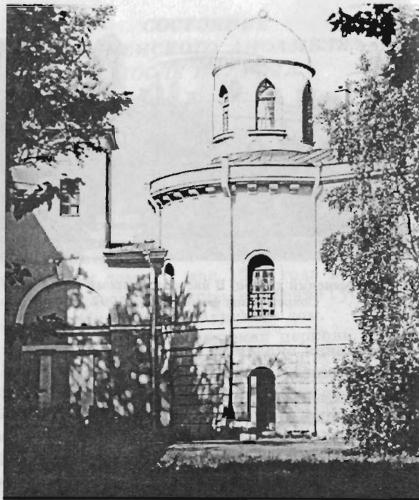
Чесменский дворец. В настоящее время ГААП. Современная фотография. 1997

В суровые годы Великой Отечественной войны дворец и церковь сильно пострадали от обстрелов. Вскоре после окончания войны было принято решение о реставрации Чесменского ансамбля. Реставрация дворца проводилась в 1954—1960 годах.