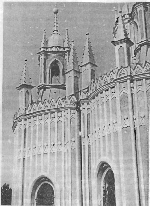
Церковь Иоанна Предтечи. Фрагмент. Архитектор Ю. М. Фельтен. Современная фотография. 1997

Необычная для архитектуры Петербурга Чесменская церковь была построена в псевдоготическом стиле. На невысоком цоколе покоится устремленное ввысь здание пятиглавого храма, стены которого заканчиваются парапетом. Тонкий рисунок его зубчиков четко просматривается на фоне неба. Остроконечные башенки завершают основные объемы церкви.