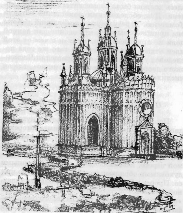
Церковь Иоанна Предтечи. Рисунок автора

к 10-й годовщине знаменитого морского сражения в Чесменской бухте.