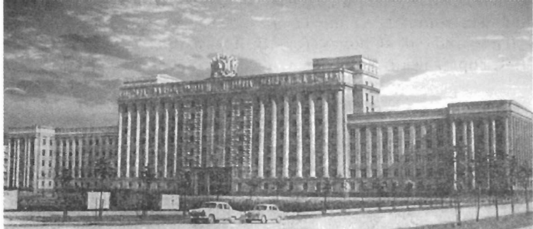
Здание Дома Советов