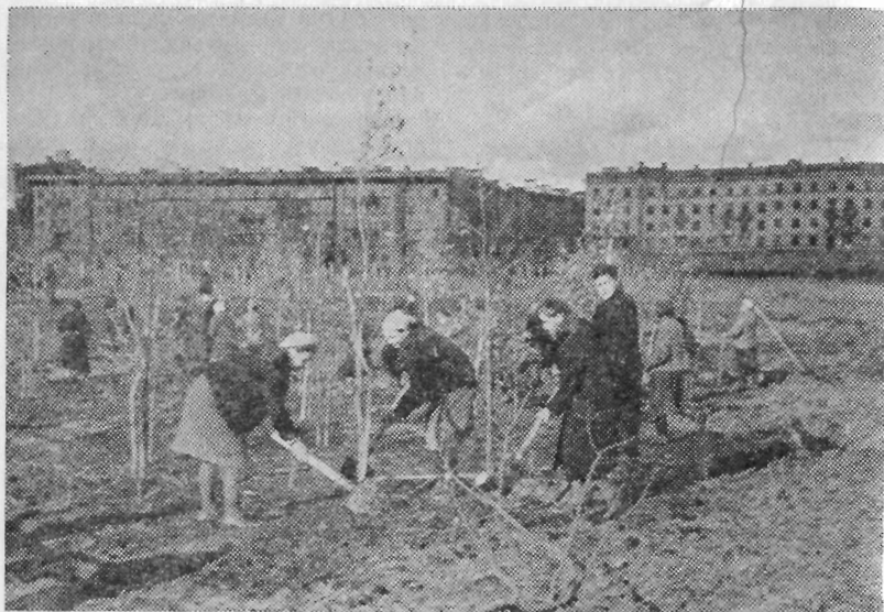
Ленинградцы сажают деревья в Московском парке Победы 7 октября 1945 г.