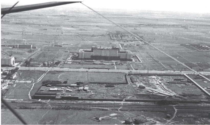
Вид на Московский проспект, здание Дома Советов и нынешнюю территорию округа Гагаринское. 1940 г.

Основной достопримечательностью муниципального образования Гагаринское является СКК «Петербургский». Спортивно - концертный комплекс им. В.И. Ленина вступил в строй в год проведения XXII летних Олимпийских